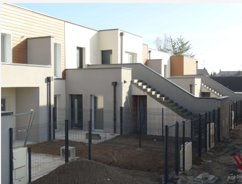
Finalisation de la résidence du Château (livraison mi-janvier)