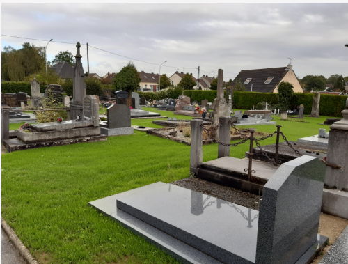
Enherbement de la partie la plus ancienne du cimetière