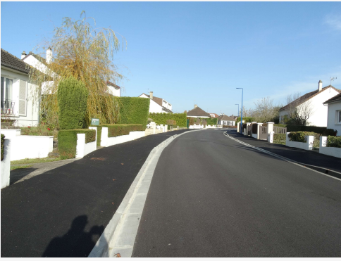
Effacement du réseau aérien rue du Commandant Cousteau