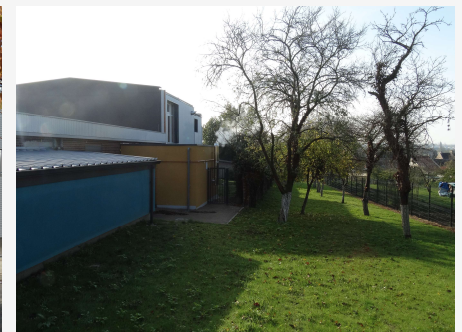
Ecole Jeanne Arnaud-Jean Cayeux : rénovation et création d'une cour « verte »