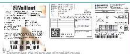
* Exemples de plaques signalétiques

Cet auto-inventaire, s'il est complet, vous évitera la visite d'un technicien à domicile.